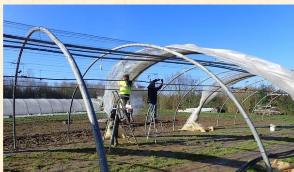
Serre en construction sur le terrain de Plaine de Vie à Ezanville